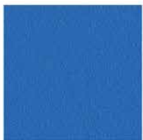
F4351-07459 Bright blue