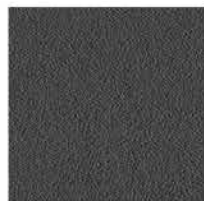
F4351-7445 Pebble grey