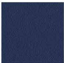
F4351-7436 Dark blue