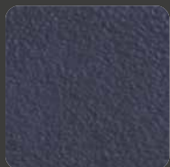
Anthrazit / Anthracite 07445